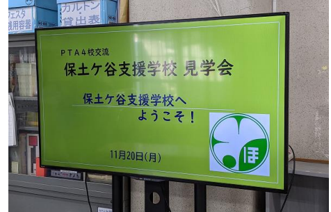
4年ぶりに開催された本校見学会

11月末に、四校交流（地域交流を目的とした権太坂小・境木小・境木中との交流）の一環として保土ヶ谷支援学校本校の見学会を開催いたしました。コロナ禍において長らく開催が見送られてきましたが、4年ぶりに開催することができ嬉しく思います。当日は各校の保護者の方々にご参加いただき、支援学校の特徴や支援内容についてお聞き頂きました。