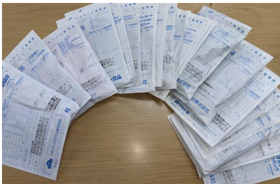
集計されたベルマークの・・・山！